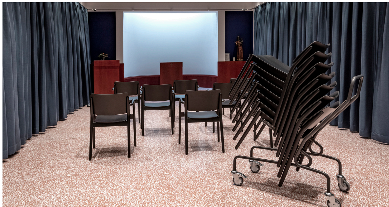
Komfortabel, robust, stapelbar, extrem vielseitig und in unzähligen Versionen verfügbar: der Holzstuhl «Viena» von Seledue.

ruktion des Stuhls sichtbar betont wird. Trotz seiner Masse handelt es sich um einen Stapelstuhl, was ihn auch für Mehrzweckräume prädestiniert. Mit dem praktischen Stapelwagen lassen sich die Stühle leicht von Raum zu Raum verschieben. Dabei unterscheidet er sich von vielen anderen Stapelstühlen durch einen herausragenden Sitzkomfort, eine grosse Wohnlichkeit und die Möglichkeit unterschiedliche Dimensionen, Materialien und Farben zu wählen. Sogar individuelle Anpassungen bei den Massen sind möglich.